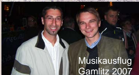
Musikausflug Gamlitz 2007