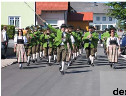
Musikheim einweihung des Musikvereins Gampern