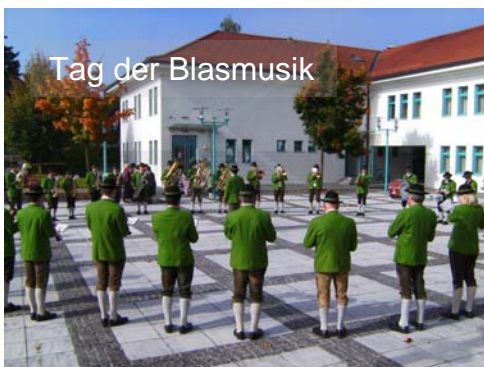
Tag der Blasmusik

Impressum: Medieninhaber und Herausgeber: MMK Seewalchen am Attersee, 4863 Seewalchen am Attersee Für den Inhalt verantwortlich: MMK Seewalchen Redaktion und Gestaltung: Herbert Bauernfeind Druck: Hltzl Druck GmbH, 4880 St. Georgen, 07667/6439