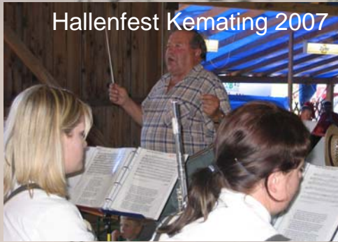
Hallenfest Kemating 2007