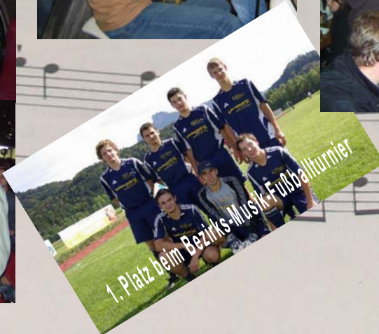
1. Platz beim Bezirks-Musik-Fußballturnier